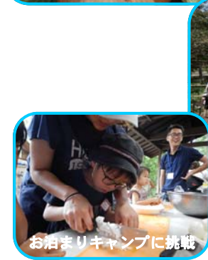
お泊まりキャンプに挑戦